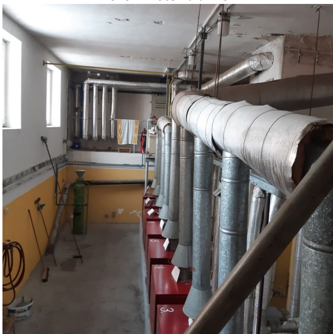
Školní kotelna dříve: