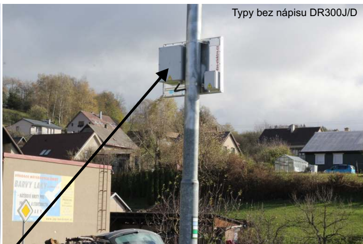
Typy bez nápisu DR300J/D

Napájecí část včetně baterie/automatické dobíjení z VO nebo fotovoltaického panelu je vždy součástí dodávky v ceně radarového měřiče.