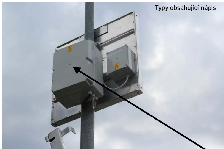
Typy obsahující nápis