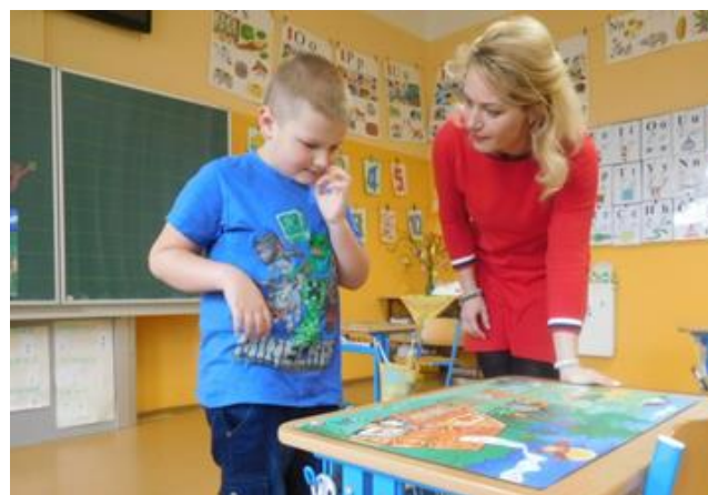
Zápis do 1. třídy