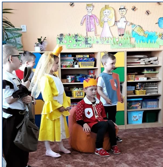
Otec král a Zlatovláška