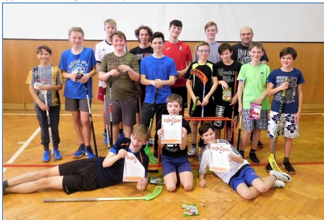
Sportovní turnaj – ve florbale