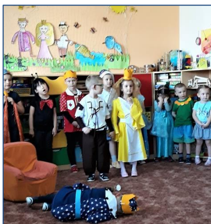
Starý král padl k řemí