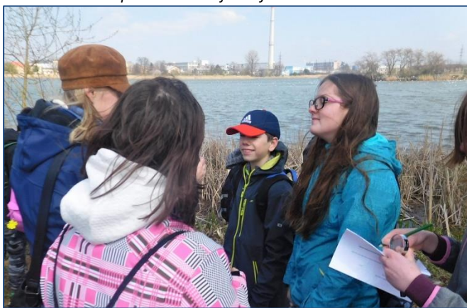
U rybníku v Chropyni