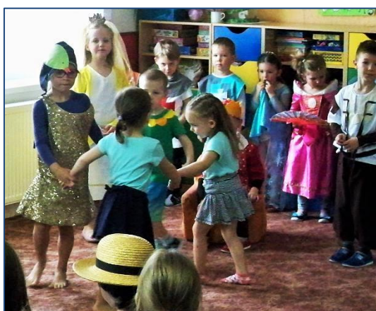
Zlatá rybka a její potěr