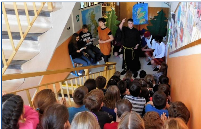
Divadlo na schodech – skvělá a poučná aktivita žáků 9. ročníku vyprávěná v angličtině i s překladem.