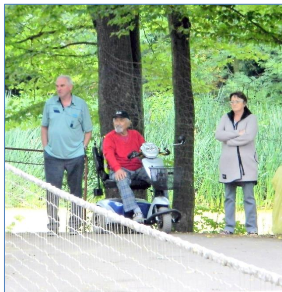
15. 7. 2017 Karlovice. Hasiči a příznivci fotbalu uspořádali tradiční ročník turnaje v nohejbalu tříčlenných družstev.