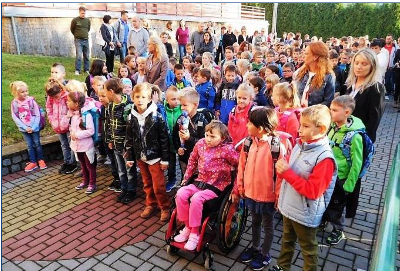
↓ Prvnáční ve školním roce 2017 - 2018