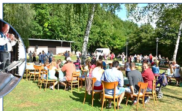
Příjemné hodové posezení na výletišti Myslivna