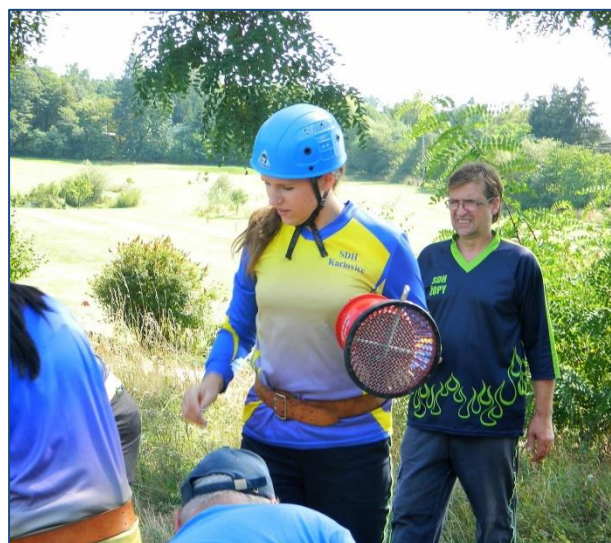
26. 8. 2017 Žopy. Smíšené družstvo se umístilo v netradičním závodě na 8. místě.