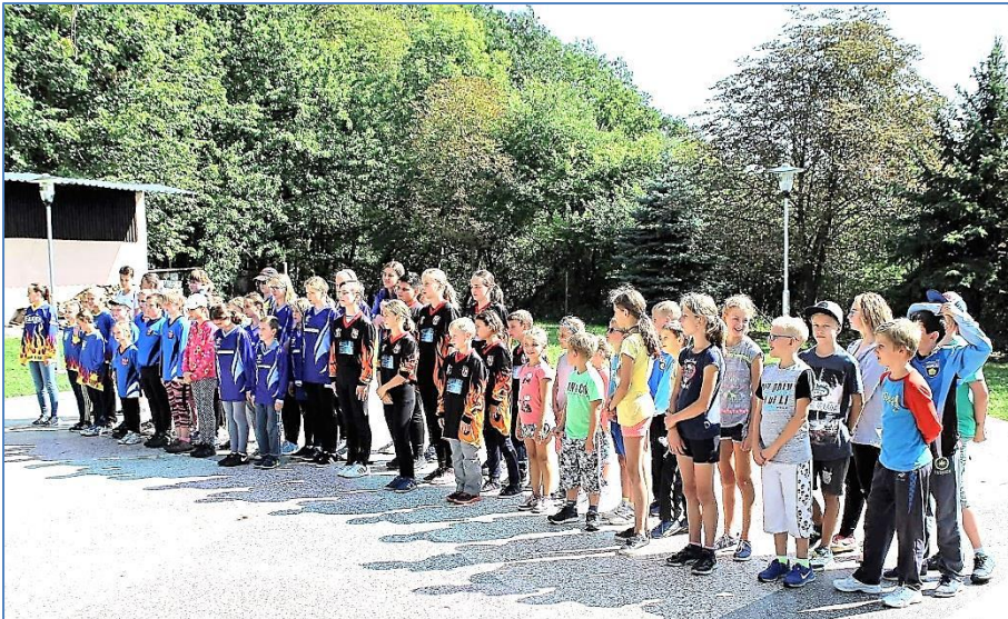
9. 9. 2017 Němčice. V závodech branné všestrannosti skončili mladí hasiči na 8. místě.