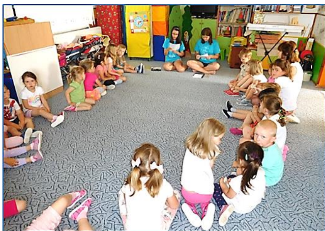
Čtení v mateřské škole, str. 7