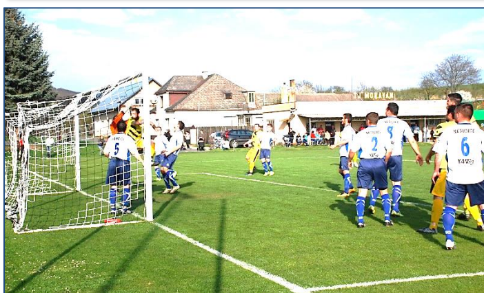
Góóó!!! Derby Kostelec - Němčice