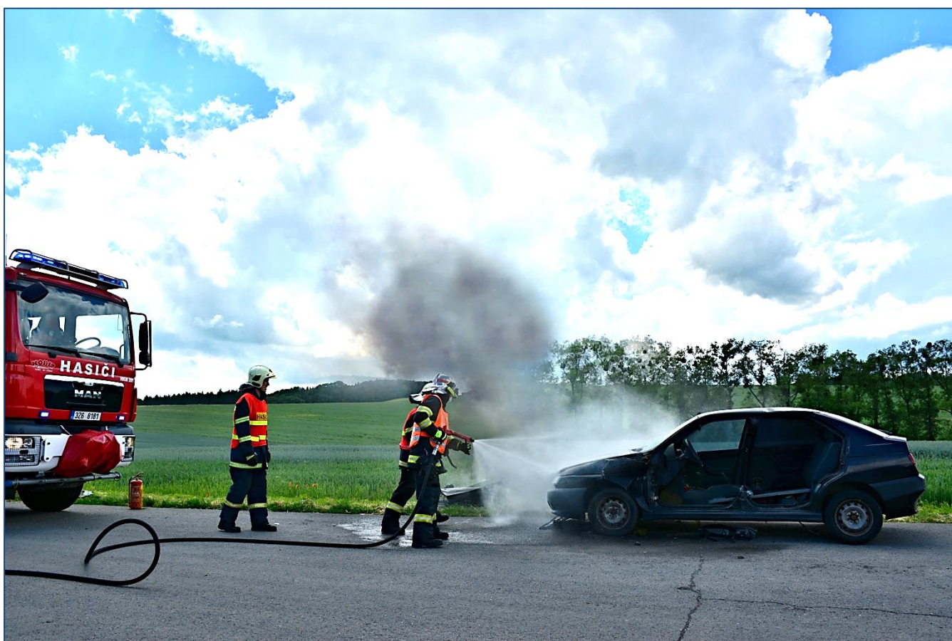
V atraktivním programu vystoupili na oslavách i moderně vybavení hasiči z Holešova