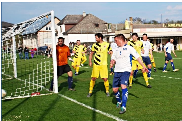
↑ „A máš to tam, máčko!“ (Derby Kostelec – Němčice)