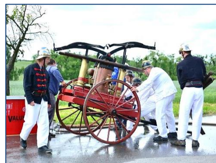
Historická technika z Rožtění