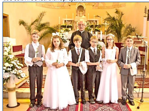
↑ První svatě přijímání. Foto s panem farářem. Str. 10.