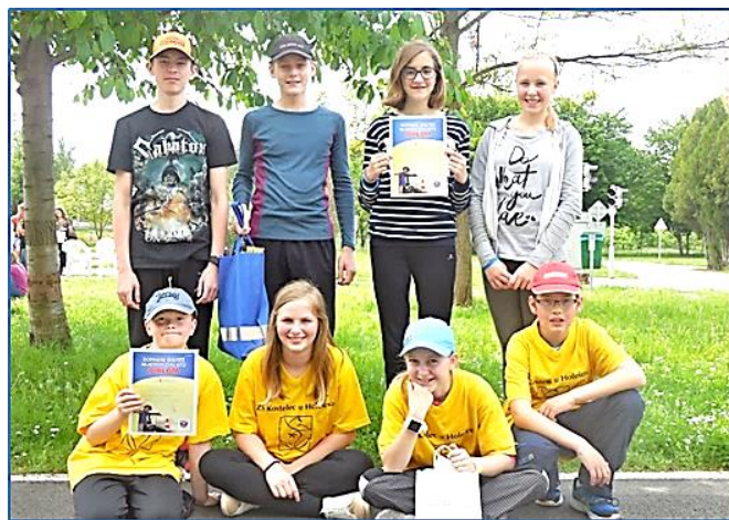
Diplomy z dopravní soutěže, str. 8