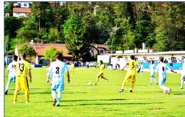
Jako hosté v Lůžkovicích