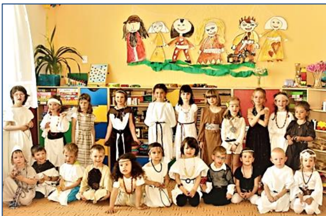
↑ Družina starých Slovanů. str.6.