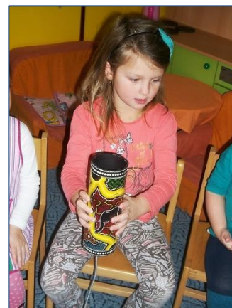
↑ Hromový bubínek ↓ Velká dešťová hůl