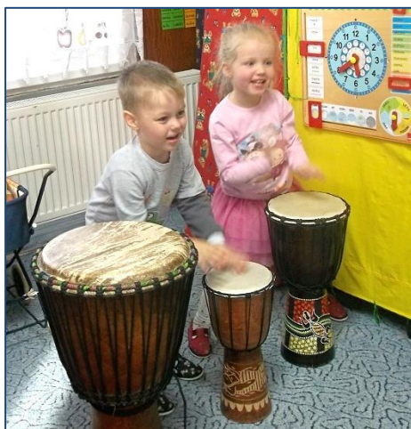
↑ Africké djembe ↓ Relaxace s tibetskou mísou