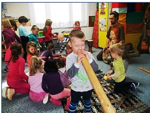
↑ Australské didgeridoo ↓ Mořský bubínek

Zdeňka Zaviačičová, MŠ Kostelec u Holešova