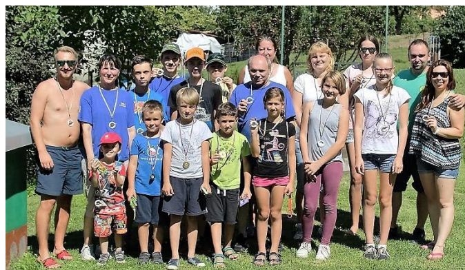
Ing. Ladislav Pospíšilík