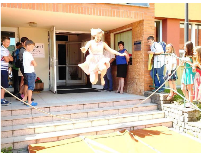
Završením pak byl jako každoročně symbolický skok do života.