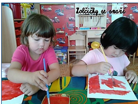
holčičky se snaží

Zdeňka Zaviačičová, MŠ Kostelec u Holešova