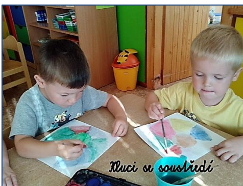
kluci se soustředí