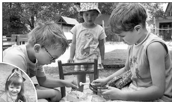
Střídání vědeckých týmů