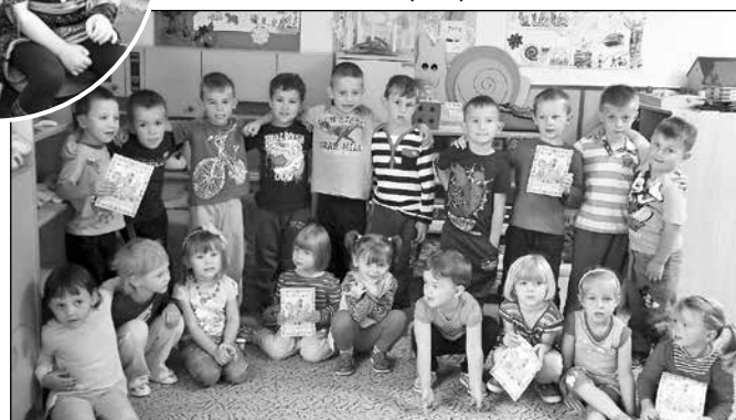
Září - nová třída