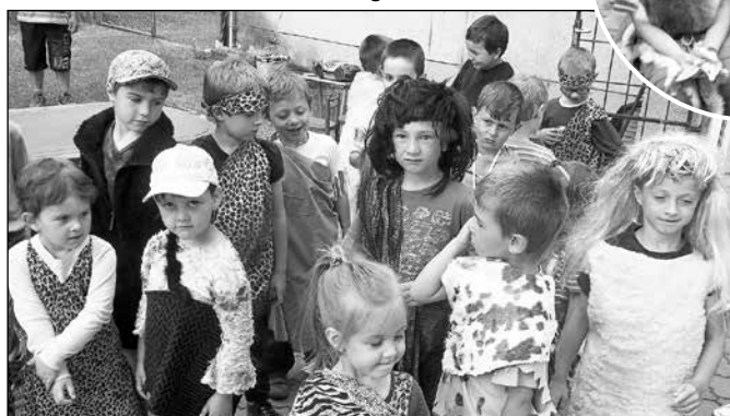
Tlupa před lovem mamuta