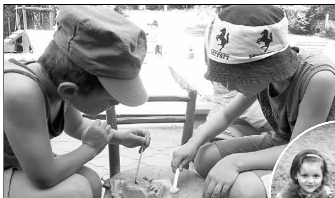
Paleontologové v akci