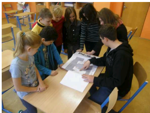
Parlamentní skupina při činnosti

ke zdraví a občanské výchovy. Ve výtvarné výchově projevovali žáci své nápady formou výkresů. Na konci pak byla projektová studie, dle které bude proměna realizována.