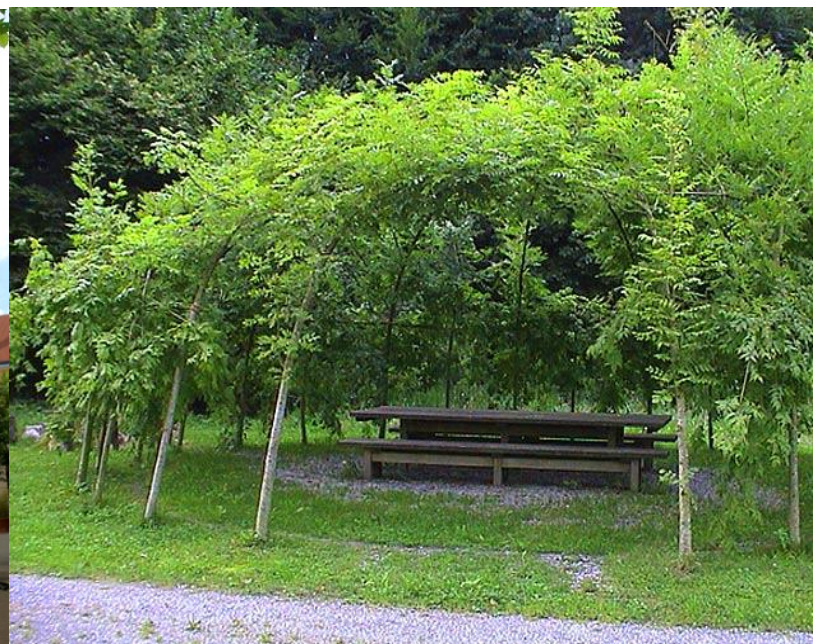
UMÍSTĚNÍ PRVKŮ V RÁMCI ŘEŠENÉ ČÁSTI