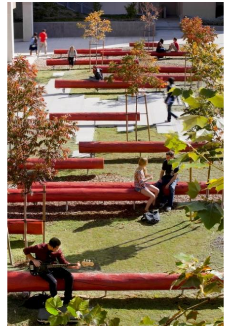
8. SEZENÍ PŘED ŠKOLOU