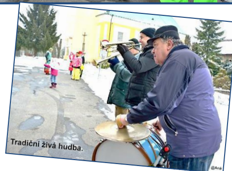
Tradiční živá hudba.