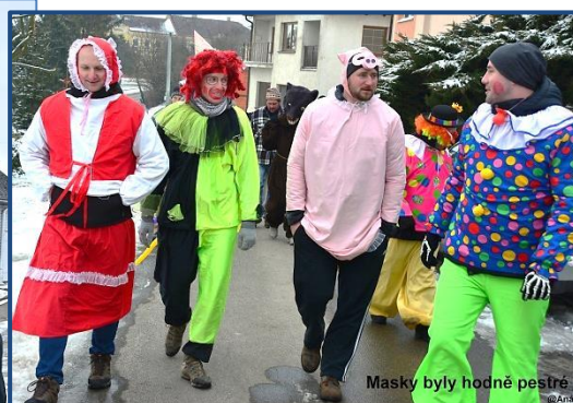
Masky byly hodně pestré