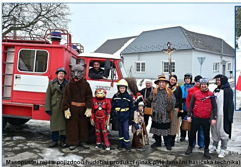
Masopustní rej i s pojzdnou hudební produkcí (jinak plně funkční hasičská technika)