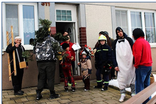
Ing. Ladislav Pospíšilík, foto autor