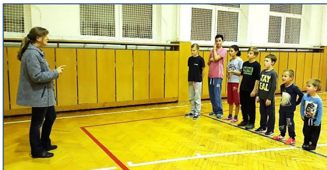
Kolektiv mladých hasičů V průběhu ledna až března se mladí hasiči připravovali na hasičské soutěže v tělocvičně základní školy

4. 3. 2018 se hráli členové sboru a obce hokejové utkání s pozvanými účastníky z Kostelce.