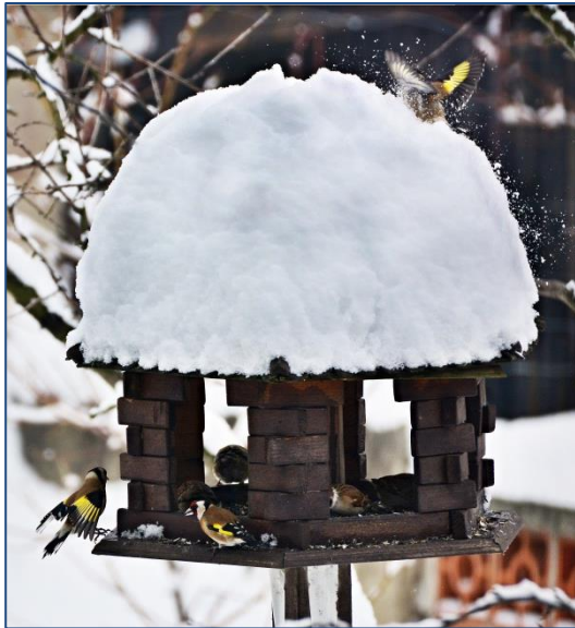
↑ Rozmarní stehlíci Odvážní tři králové v -17 °C → (k článku na straně 11)