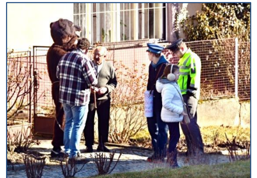
← Veselí medvěďáři v Karlovicích Kostecký medvěd u pana faráře ↑ a na Holčici ↓