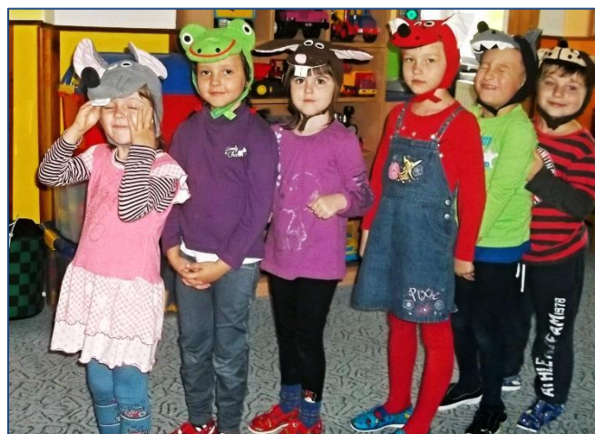
↑ Rádi hrajeme divadlo: Pohádka o budce ↓