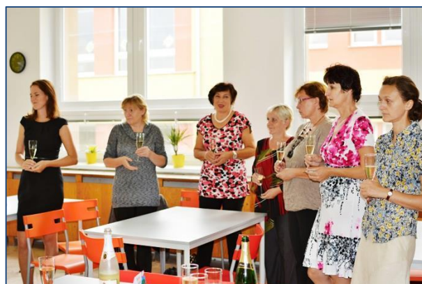
Slavnostní otevření nového provozovatele školní jídelny