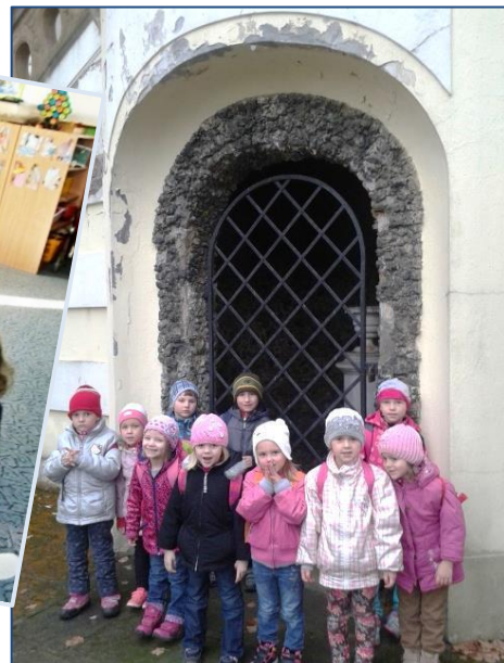
Na výletě v Kroměříži ↑ Švestkový koláč. Mňam! ↓