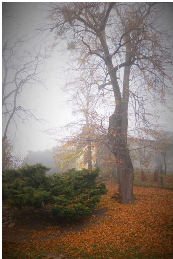
Malebné podzimní kostelecké zátiší