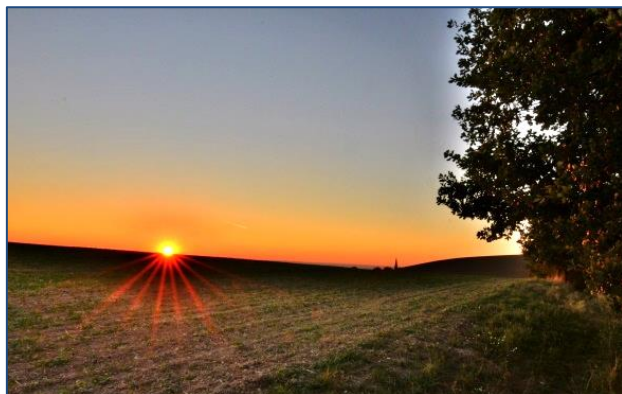
Západ slunce z vyhlídky nad Starou Vsí