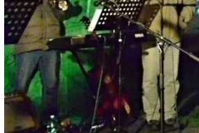
↑ Trubkové sólo p. Bucháčka a rozsvícení vánoční strom Pěvecký soubor Kosteláň → Žesťový kvintet →→