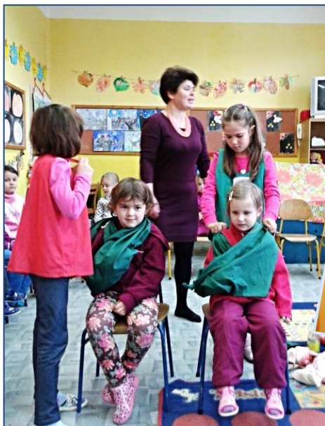
↑ Pohádka o první pomoci ↓ Stavba patrových garáží