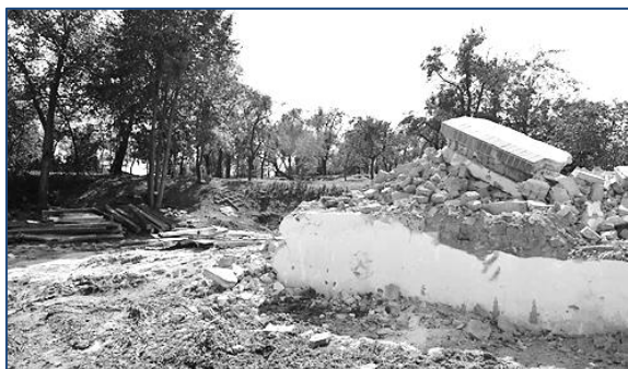
Mizí starý a ne příliš vzhledný Kostelec