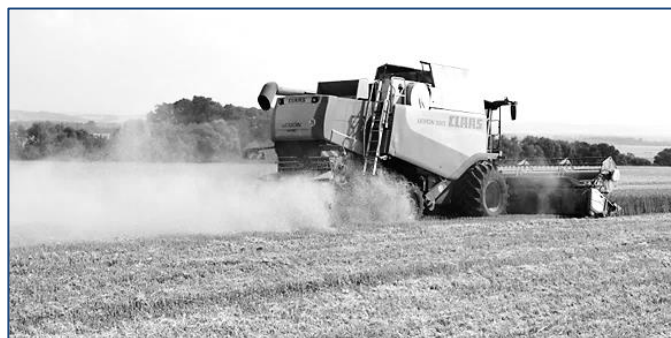
Letošní prašné žně