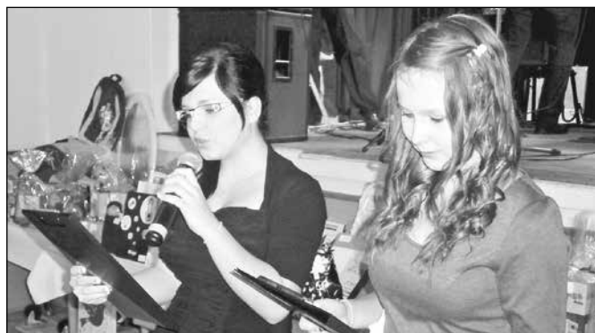
Žákovský ples - akce školního parlamentu