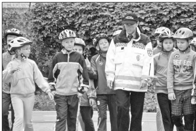
Výuka na dopravním hřišti