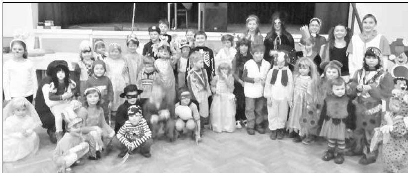
Maškarní karneval pořádala škola ve spolupráci s kulturní komisí rady obce.