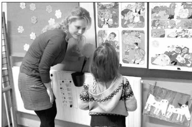
Zápis dětí do 1. třídy pro školní rok 2014/2015