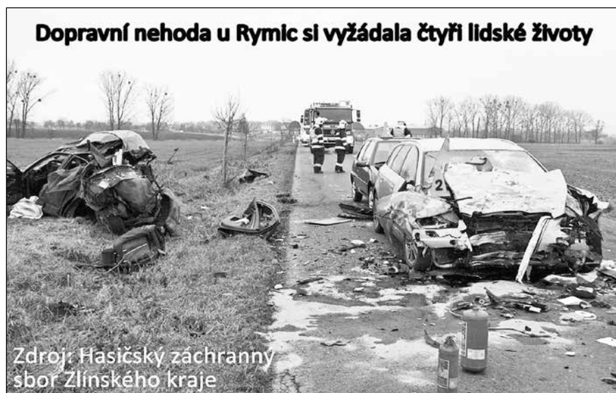
Dopravní nehoda u Rymic si vyžádala čtyři lidské životy

por. Bc. Libor Netopil, tiskový mluvčí HZS Zlínského kraje